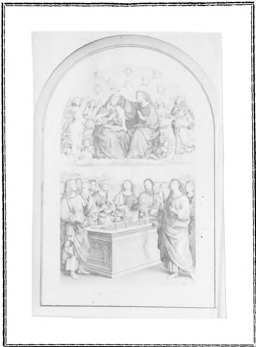
TABLEAU DE RAPHAEL (Musée du Vatican)