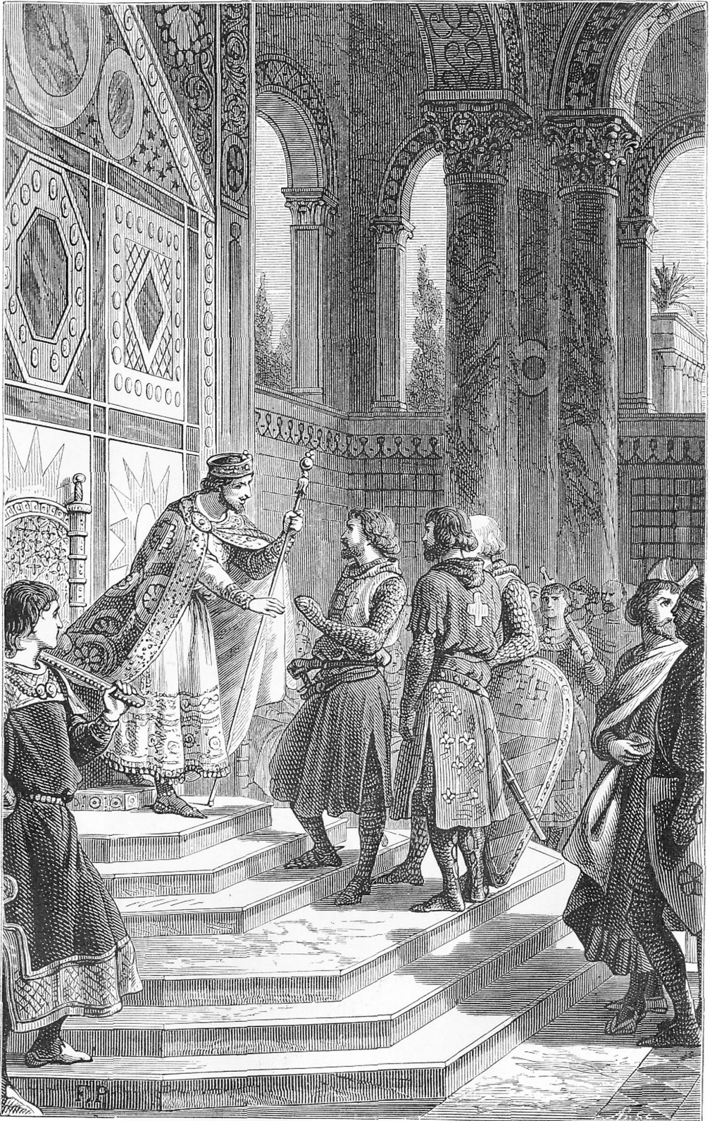
Godefroi et les barons reçus par l'empereur Alexis. (Ch. V.)