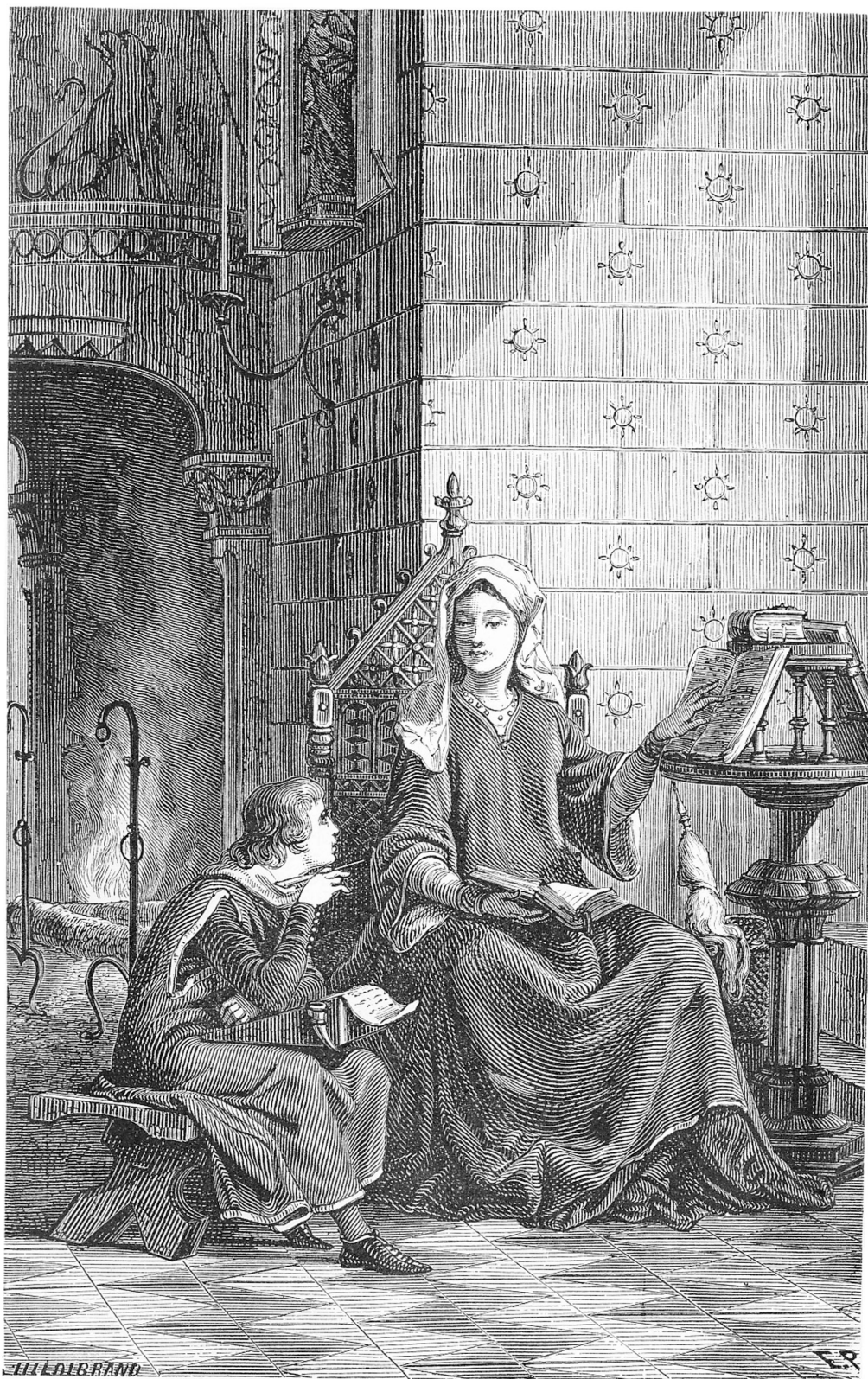
Godefroi fut instruit par sa mère, sainte Ide. (Ch. I er .)