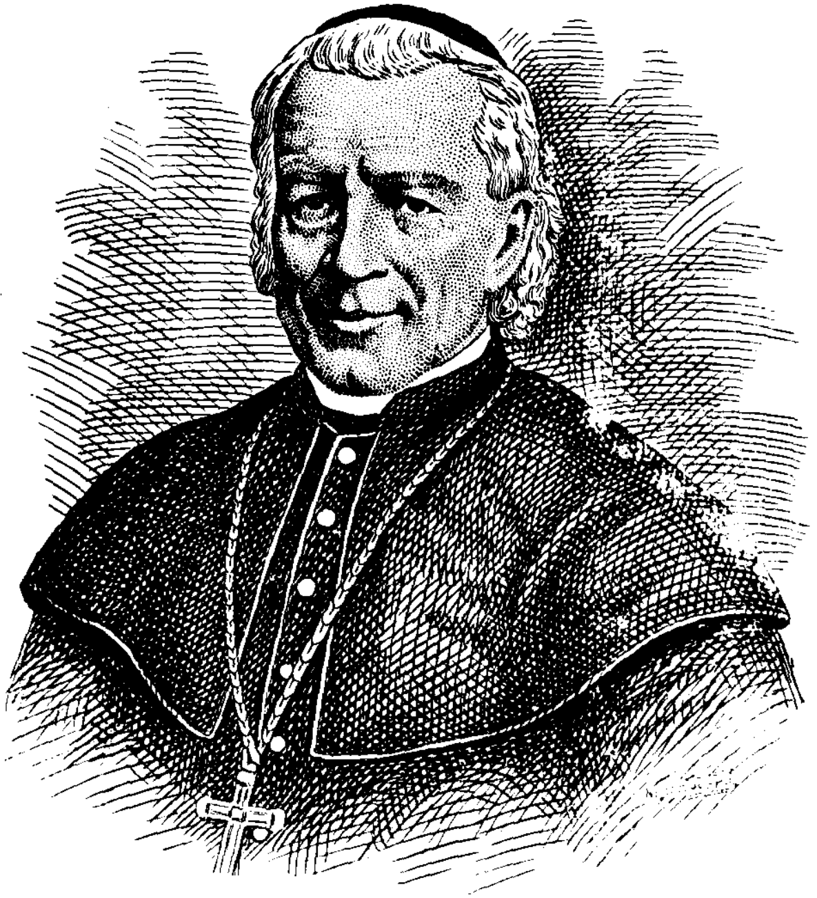
MGR IGNACE BOURGET,

Né à Lévis (Québec) en 1799 ; élève du Séminaire de Québec comme Mgr Plessis ; 2 e Evêque de Montréal, en 1840 ; mort en odeur de sainteté, le 8 juin 1885.