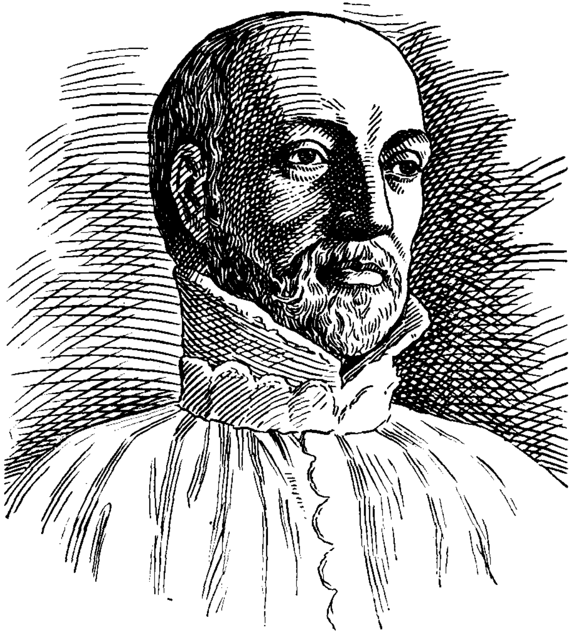
JEAN DE BRÉBEUF, PÈRE JÉSUIE.

Né en 1593, arrive au Canada en 1625 ; missionnaire chez les Hurons dont il convertit 7,000 ; fait prisonnier par les Iroquois et martyrisé avec le P. G. Lalemant, au milieu des plus horribles tourments, à la bourgade de St-Louis, en 1649.