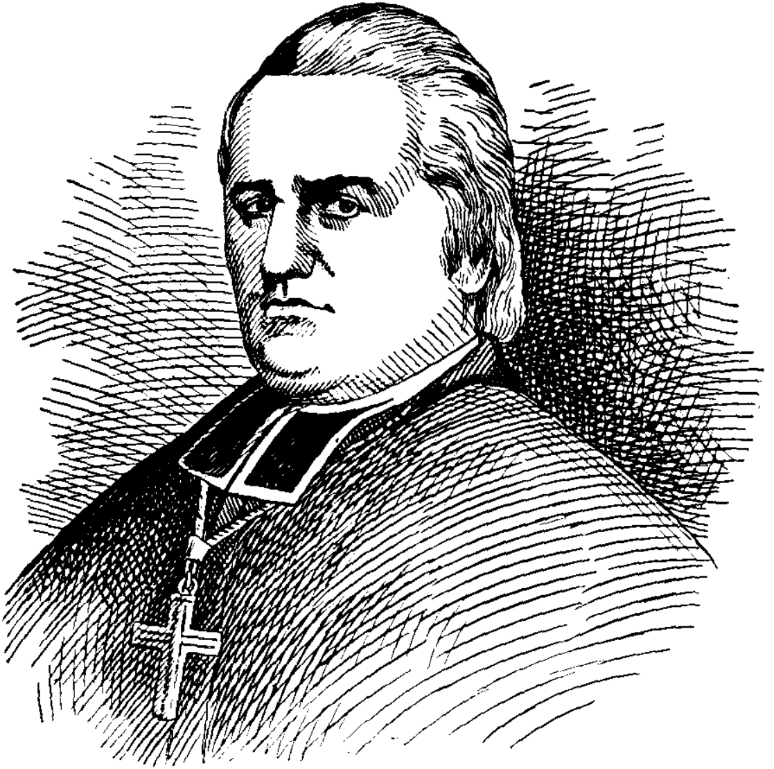
MGR JOSEPH-OCTAVE PLESSIS,

Né à Montréal, en 1763, 11e évêque de Québec en 1806, décédé en 1825.