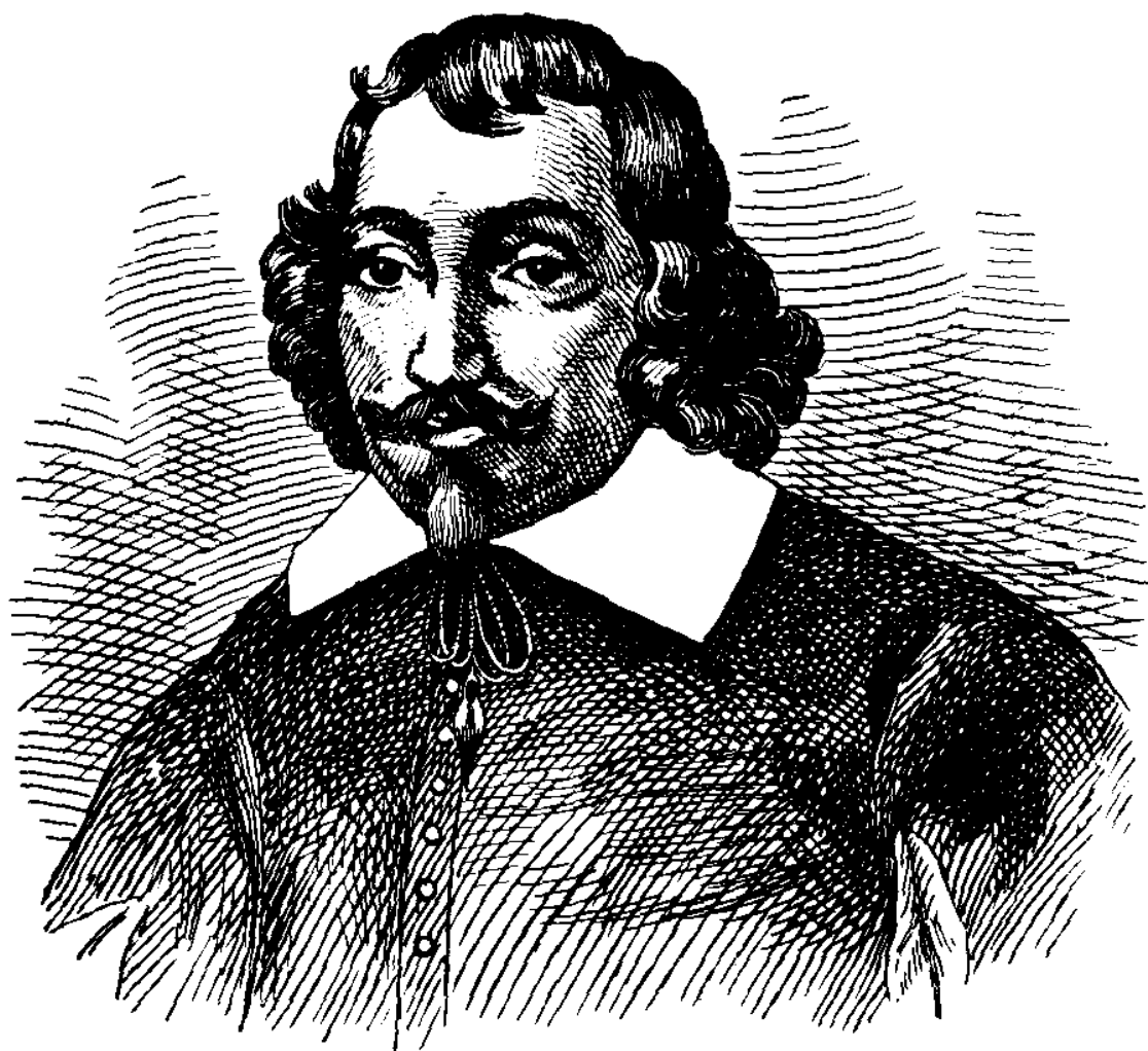
SAMUEL DE CHAMPLAIN,

Né en Saintonge, en 1565 ; décédé à Québec, le 25 décembre 1635. Grand chrétien ; fondateur de Québec, père de la Nouvelle-France.