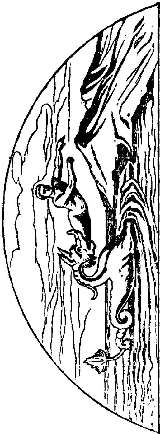
Le prophète JONAS, figure de la Resurrection de Notre-Seigneur Jésus-Christ. (Matt., XII, 40) Fresque du cimetière de Saint-Calliste. (Martigny, p. 344.)