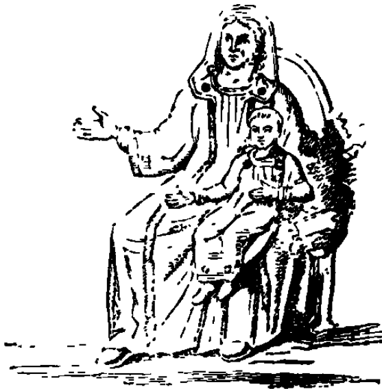
La Sainte Vierge et l'Enfant Jésus, Fresque du Cimetière de Domitille. (V. Martigny, p. 658.)