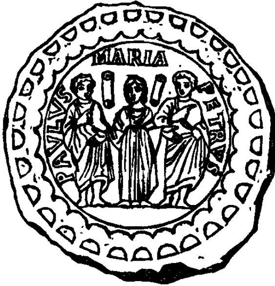
Fond de verre doré représentant la sainte Vierge entre saint Pierre et saint Paul ; dans le champ, deux volumes symboles de la loi divine. (Martigny, p. 660.)