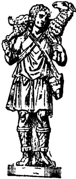
JÉSUS-CHRIST sous la figure du BON PASTEUR. Statue de marbre blanc.

devait remplir le cœur du chrétien d'admiration, de reconnaissance et d'émotion. Tantôt le pasteur caresse avec tendresse la brebis retrouvée, amoureusement penchée sur son cou; tantôt il lui parle avec douceur, pendant