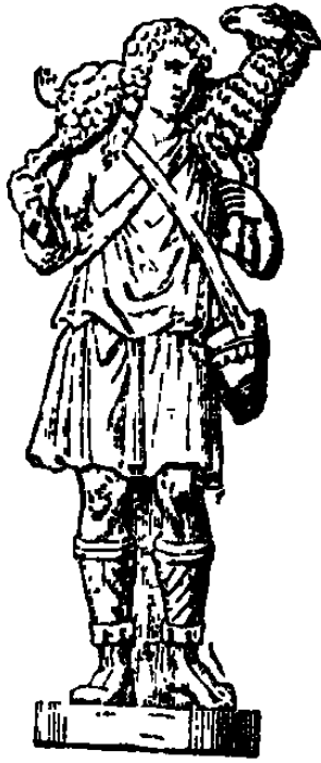
JÉSUS-CHRIST sous la figure du BON PASTEUR. Statue de marbre blanc. (Martigny, p. 515.)