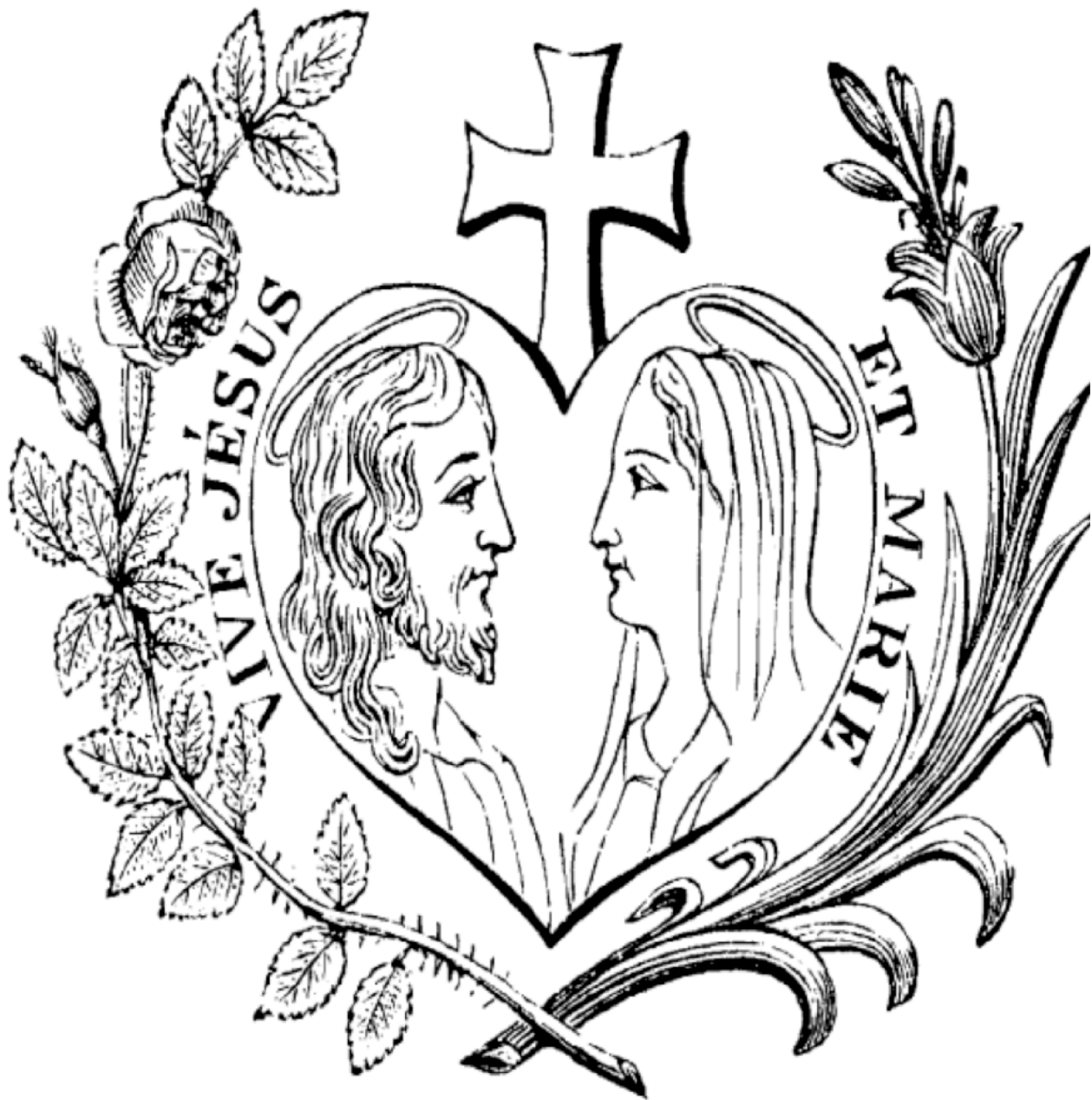
L'une des Armoiries de la Congrégation de Jésus et Marie, dite des Eudistes, fondée par St Jean Eudes en 1643.