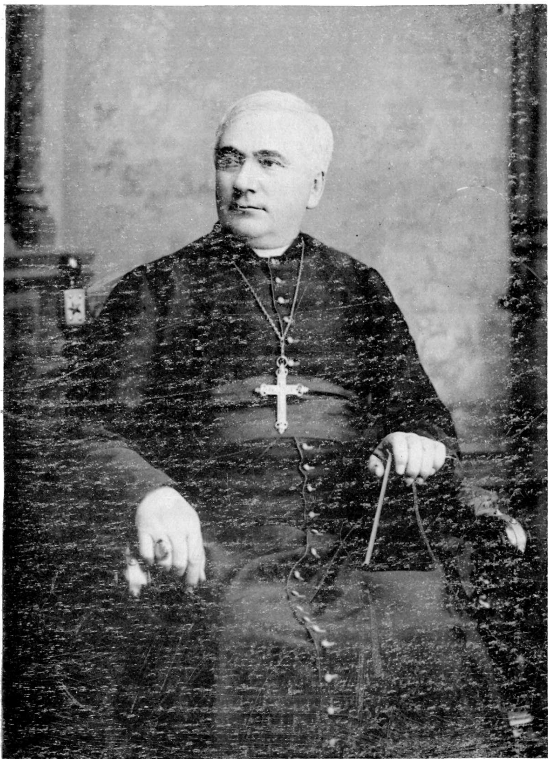
MGR. VITAL-JUSTIN GRANDIN, O. M. I. EVEQUE DE SAINT-ALBERT.