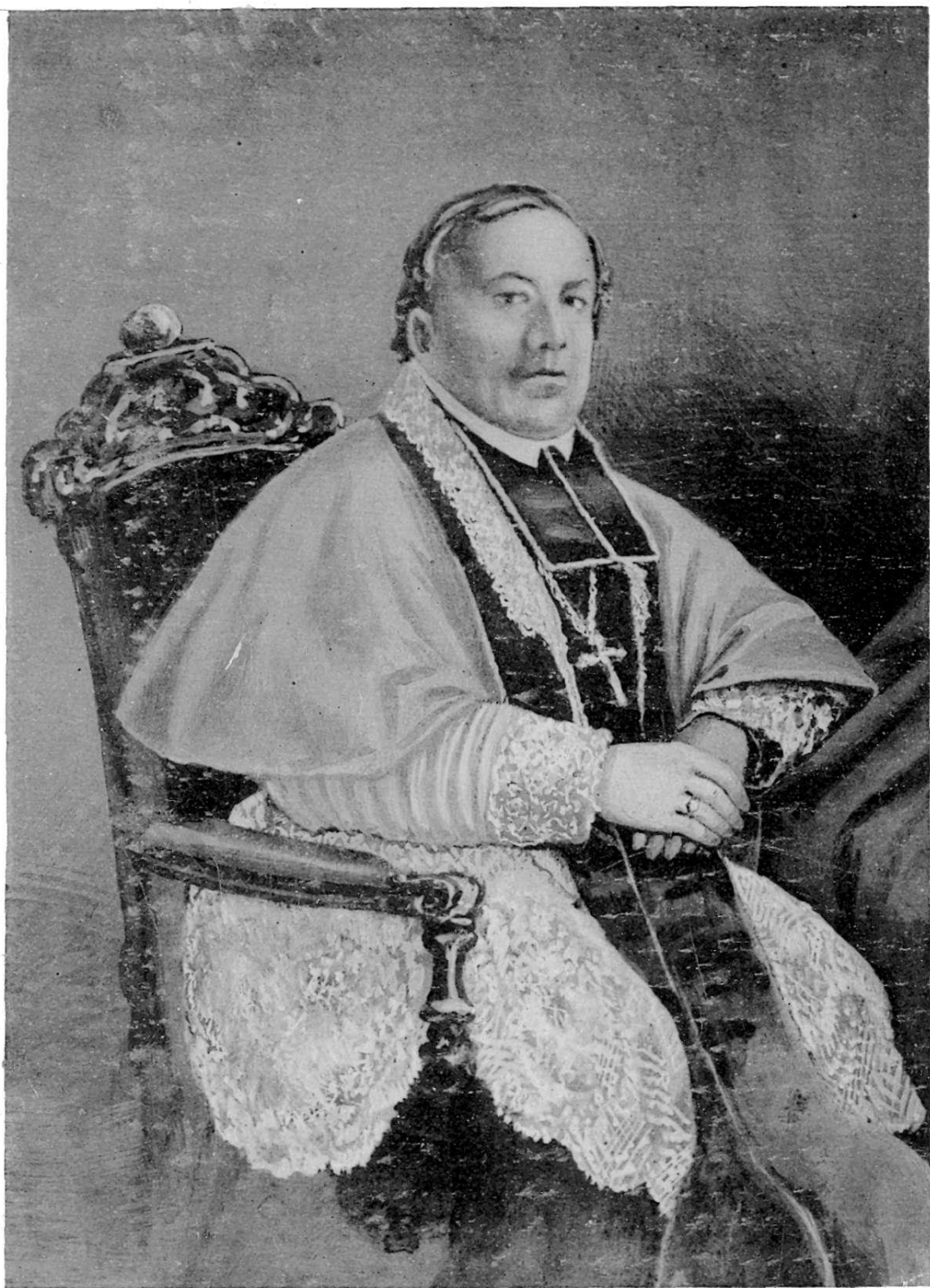
MGR. JOSEPH-NORBERT PROVENCHER, PREMIER EVÊQUE DE SAINT-BONIFACE.