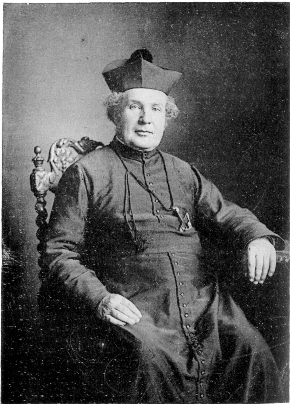
TRÈS-RÉVÉREND PÈRE JOSEPH FABRE, SECOND SUPERIEUR GENERAL DES OBLATS, M. I.